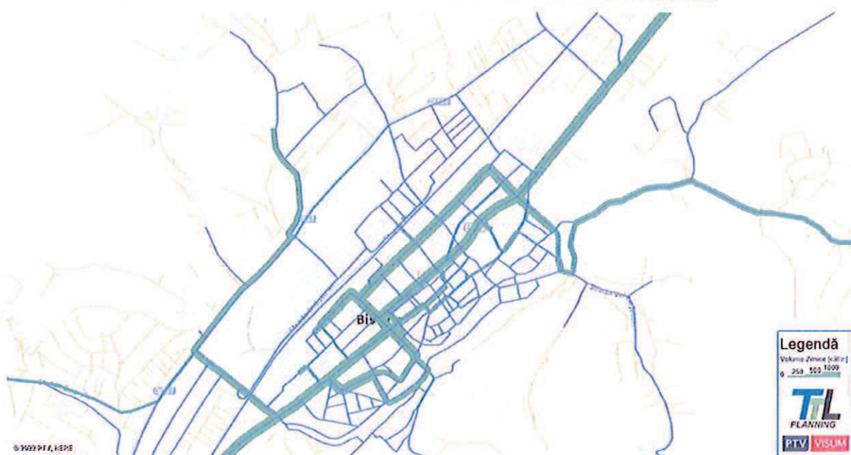
FIGURA 120. MĂRIMEA FLUXURILOR DE TRAFIC – TRANSPORT PUBLIC – AN DE PROGNOZĂ 2027