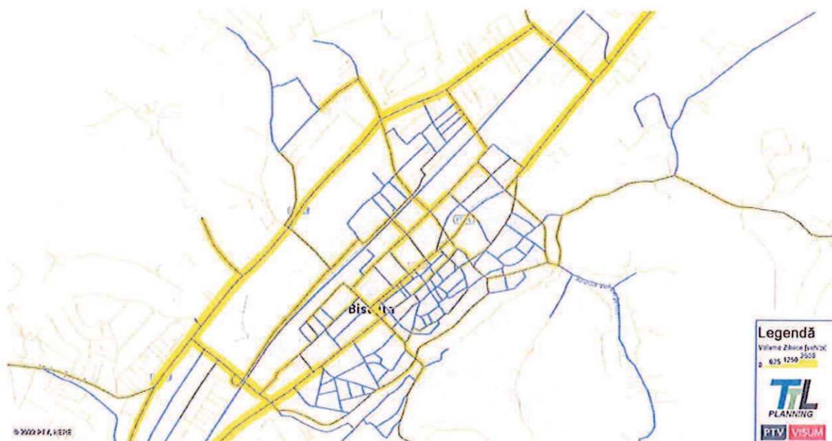
FIGURA 122. MĂRIMEA FLUXURILOR DE TRAFIC – VEHICULE UȘOARE DE MARFĂ – AN DE PROGNOZĂ 2027