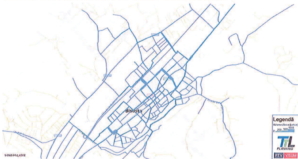
FIGURA 121. MĂRIMEA FLUXURILOR DE TRAFIC – BICICLETE – AN DE PROGNOZĂ 2027