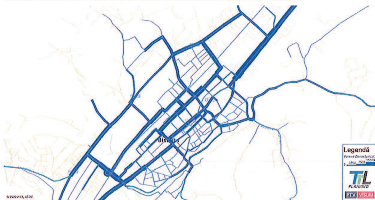
FIGURA 119. MĂRIMEA FLUXURILOR DE TRAFIC – AUTOTURISME – AN DE PROGNOZĂ 2027