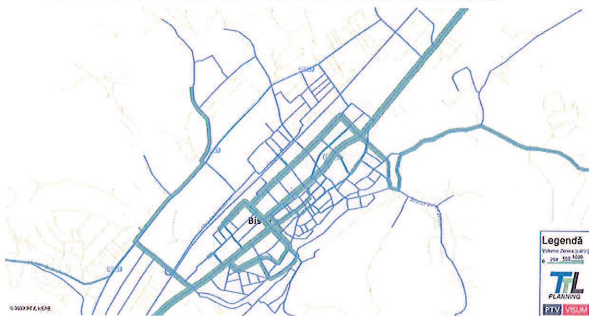
FIGURA 120. MĂRIMEA FLUXURILOR DE TRAFIC – TRANSPORT PUBLIC – AN DE PROGNOZĂ 2027