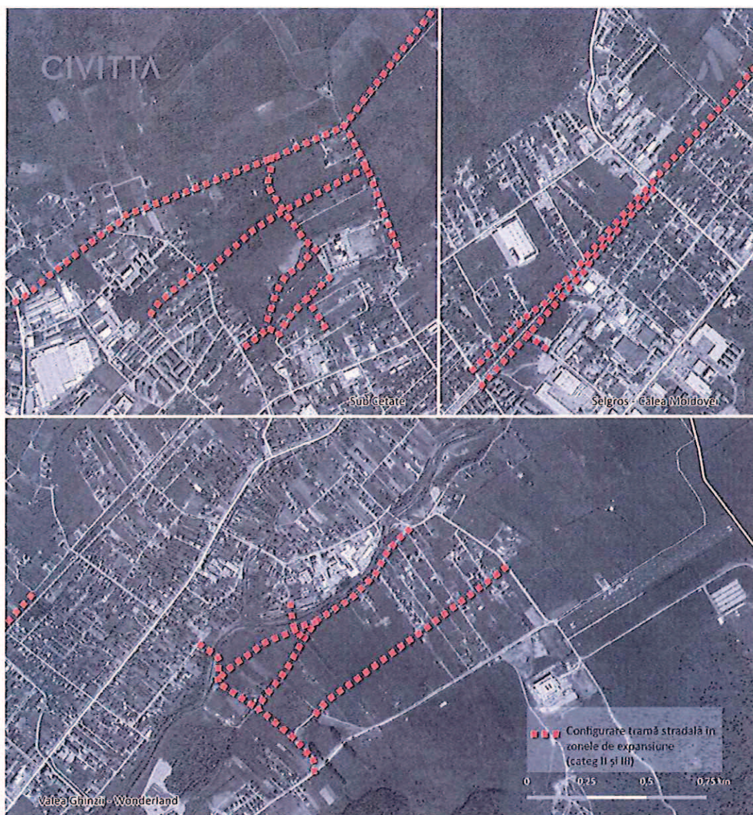
FIGURA 150 COMPLETĂRI DE TRAMĂ STRADALĂ SUGERATE PENTRU ZONELE DE EXPANSIUNE

Acest demers este important întrucât actualizarea și avizarea Planului Urbanistic General poate dura între 5 și chiar 10 ani. Între timp, dezvoltarea orașului trebuie controlată, mai ales din perspectiva infrastructurii de transport rutier. Și în cartierul Calea Moldovei e nevoie de completări ale tramei stradale. PROIECTUL COMPLETARE TRAMĂ STRADALĂ (CATEG II ȘI III) CALEA MOLDOVEI - ZONA SELGROS prevede conturarea unei artere paralele cu calea ferată care să permită descărcarea traficului de pe DN17.